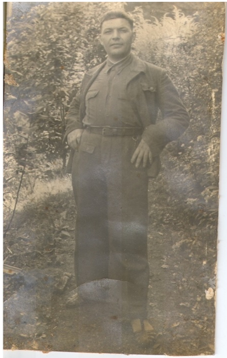
Хвоша после плена