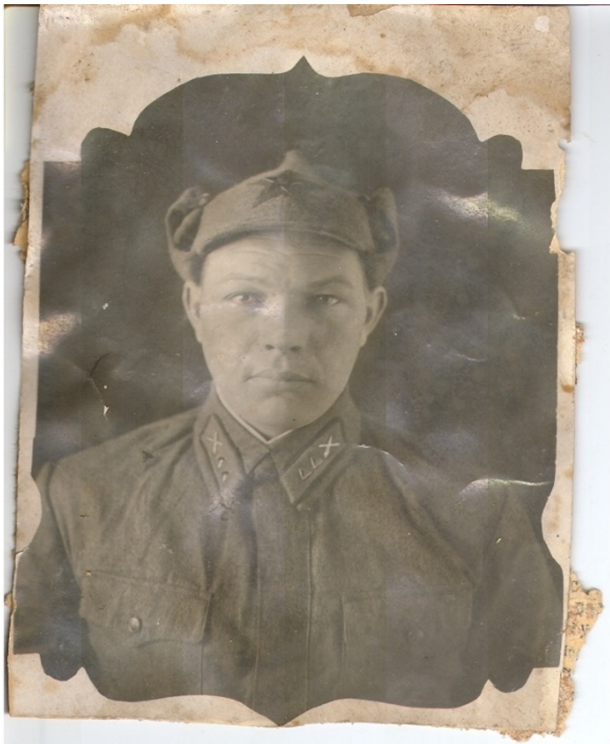
Хвоша во время войны